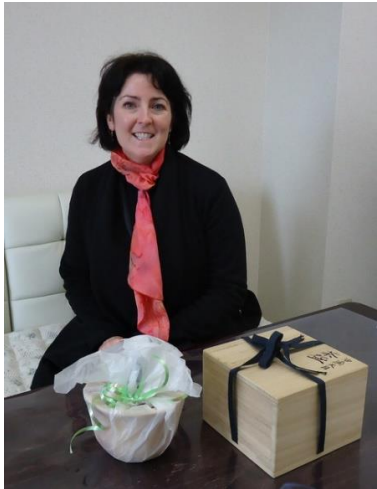
感謝状と油滴天目茶碗をプレゼント